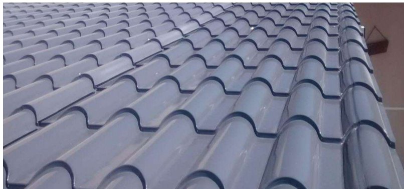
Imagem 1: telha metálica termoacústica modelo colônia na cor cinza